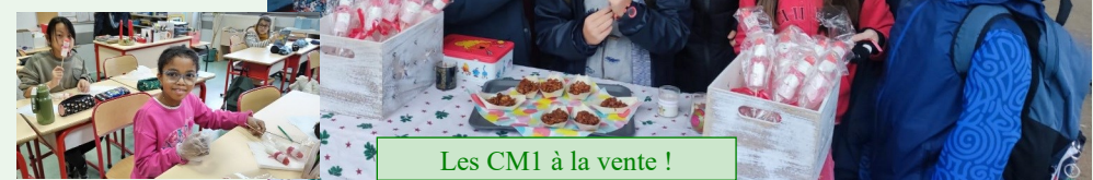
Les CM1 à la vente !

dis et jeudis ! Chaque niveau de classe a pu confectionner des friandises et le bénéfice net de ces ventes a permis de rapporter : 882 euros qui ont été reversés intégralement à Eveil Mat'Ins !