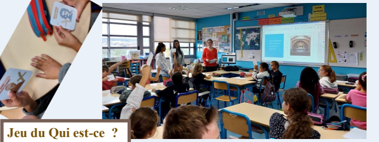
Jeu du Qui est-ce ?

Dans toutes les écoles des filles de la Croix, c'était la fête !