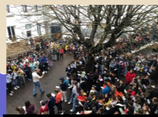
Nogent sur Marne