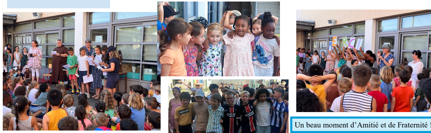
Un beau moment d'Amitié et de Fraternité !