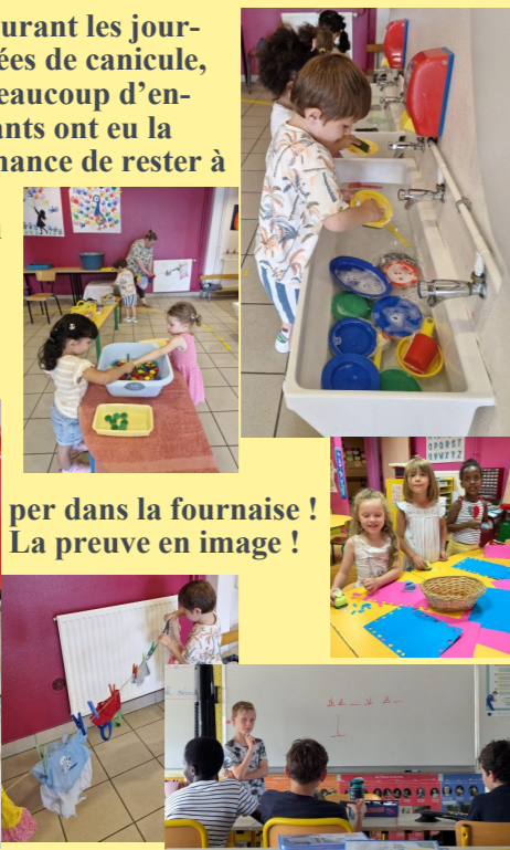
per dans la fournaise ! La preuve en image !

la maison selon les recommandations du rectorat. Pour les autres, les enseignantes ont rivalisé d'idées pour s'occu-