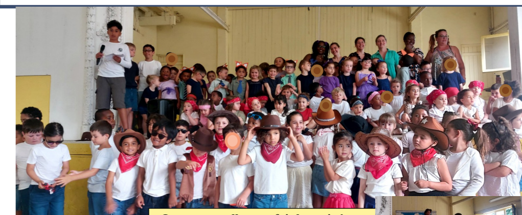
Les maternelles ont fait leur cinéma ce mardi 30 juin : Bravo à eux, ils ont très bien dansé !