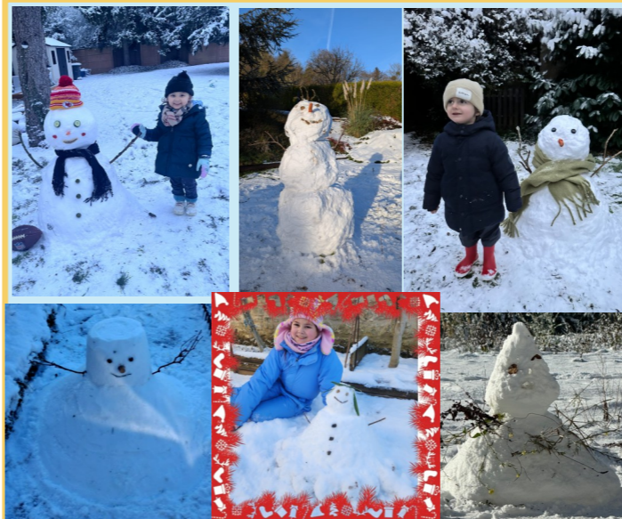
Bravo à tous les enfants qui ont répondu à la proposition de Mme de Cazenove lors de l'épisode neigeux : tous vos bonshommes de neige étaient très amusants !

En ce mois de janvier de délicieuses odeurs de galettes se sont répandues dans les couloirs de l'école et voici nos plus jeunes couronnés! Vive la Reine et le Roi de PS !