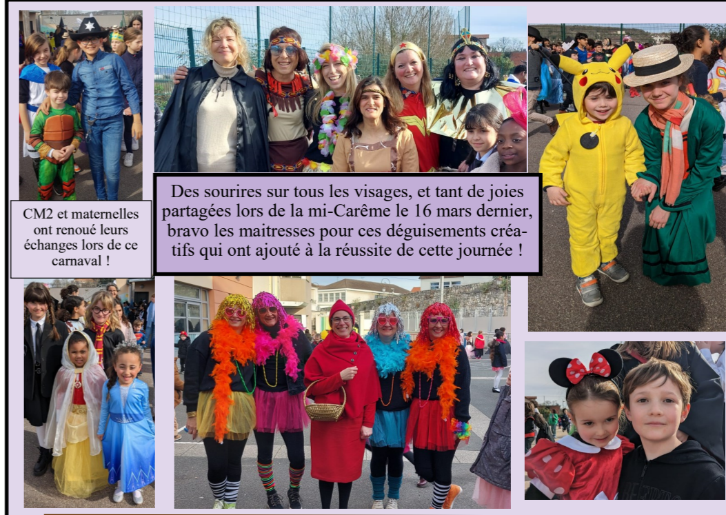
CM2 et maternelles ont renouvelé leurs échanges lors de ce carnaval !